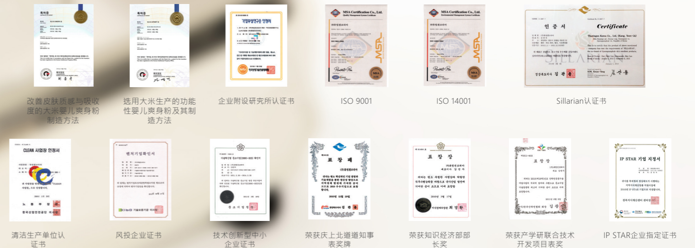
改善皮肤质感与吸收度的大米婴儿爽身粉及其制造方法